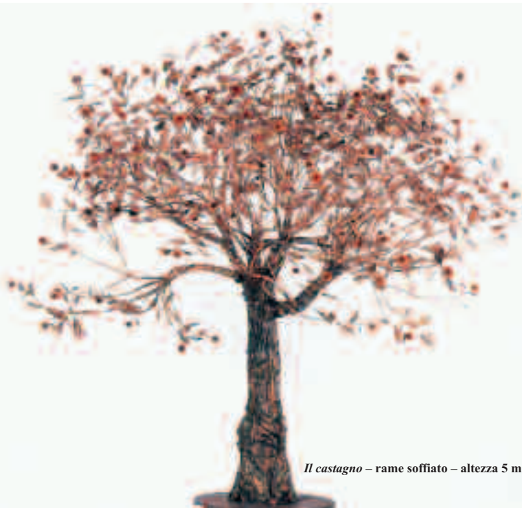
Il castagno – rame soffiato – altezza 5 m